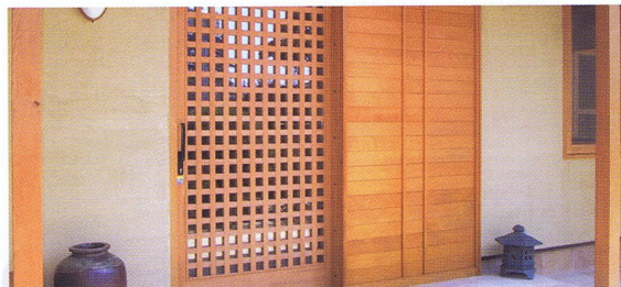
建具 コシヤマ製 木材材質ヒバ (OPライトオークル塗装)

特徴 スタンドオイルという特殊な油を主体に製造している自然塗料です。この塗料はスタンドオイルを非常に多く入れているため、木の下地によって仕上がりがあまり変わることがありません。ヒバ、ヒノキ、パインなどの樹脂分の多い浸透ムラができやすい材はスタンドオイルが木表面を整え、浸透ムラを防ぎます。又超仕上げの材にも浸透ムラなく塗装を行うことができます。非常に多くのヒバを使用する能登半島の漆職人さんたちに人気があります。やや粘度が高いため、バルサムテレピンオイルにて薄めて塗りやすくすることをお勧めします。内外装兼用で使用いただけます。塗装後ふき取ると木目が見える半透明に仕上げることが可能です。又木部以外のプラスターボード、ケイカル板、RCにも塗装が可能です。